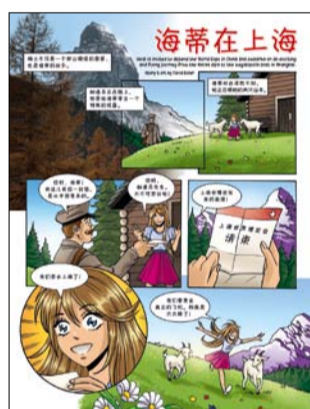
Die Schweiz in China innovativ repräsentiert: Das Magazin «Swiss Brands» (www.swissbrands.org) von Primafila AG und China Communications.